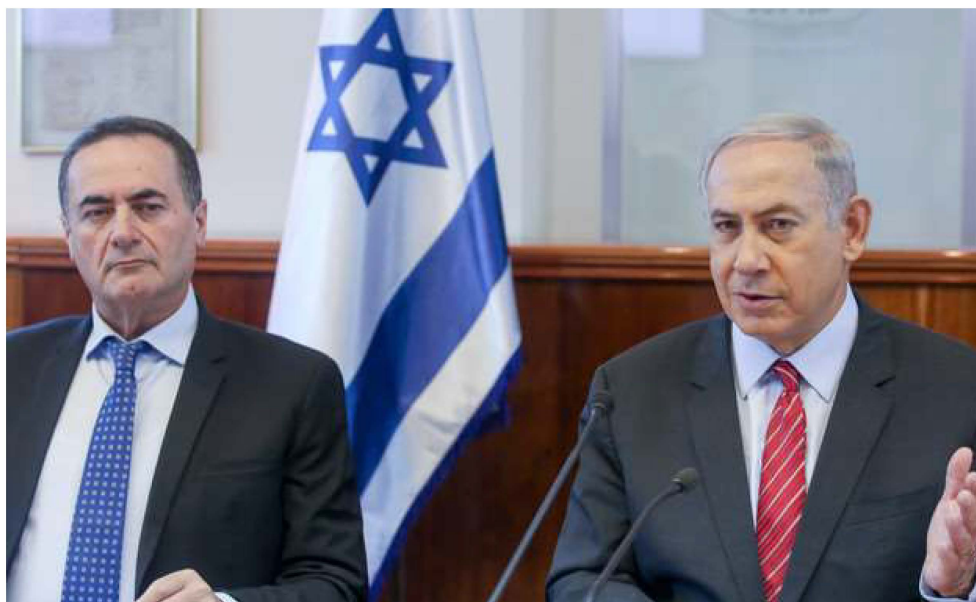
"הממשלה מוציאה כסף בלי חשבון". נתניהו וכ"ץ, ארכיון

טרכטנברג , פרופ' באוניברסיטת תל אביב במוסד שמואל נאמן של הטכניון , לא הופתע משיעורי הנירעון. "ידענו שהוא יהיה גבוה מאי פעם", אמר, "זה סדר הגודל שהיה צפוי. בכל זאת חייבים להגיד, אי הוודאות הייתה ועדיין כל כך גדולה שכל ניסיון לחזות מועד לכישלון. זה לא במסגרת המודלים וסוג הפרמטרים שאנחנו מכירים".